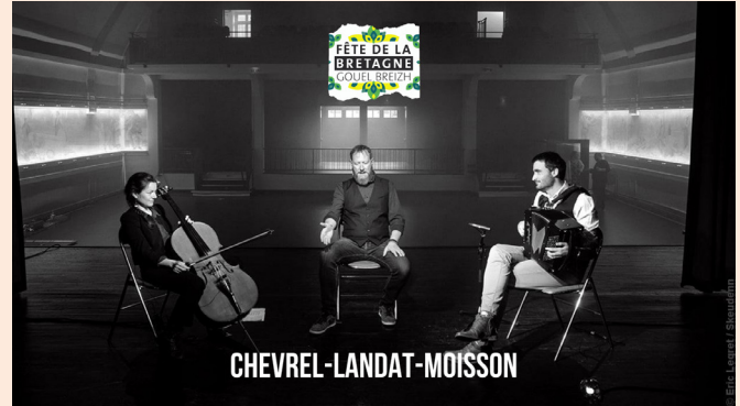
CHEVREL-LANDAT-MOISSON - Salle de la Cité

Sellit ouzh ar sonadeg / Regardez le concert :