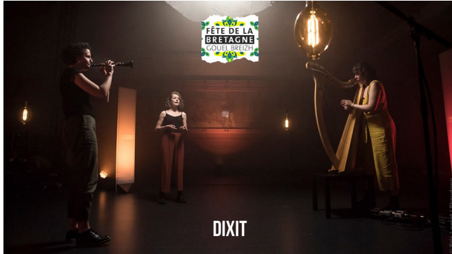
DIXIT - Salle de la Cité

Sellit ouzh ar sonadeg / Regardez le concert :